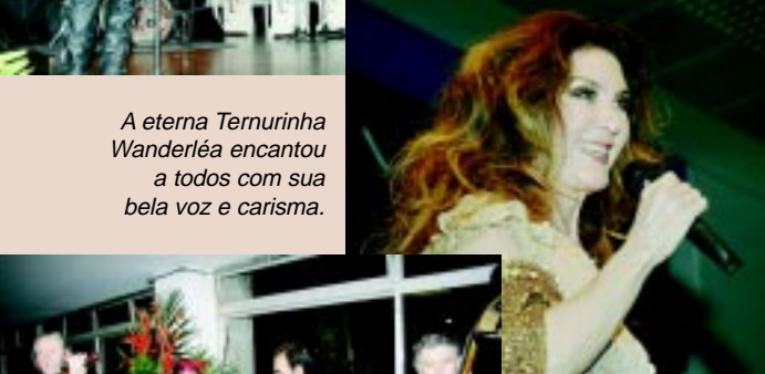
A eterna Temurinha Wanderléa encantou a todos com sua bela voz e carisma.