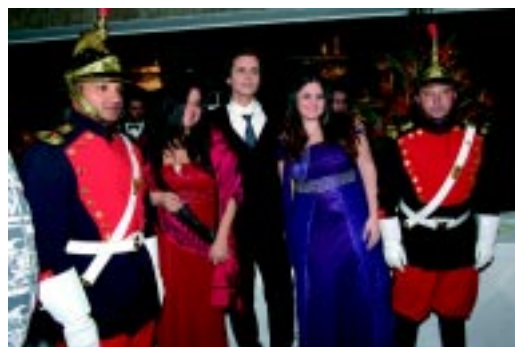
A equipe da Ação & Comunicação Assessoria de Imprensa