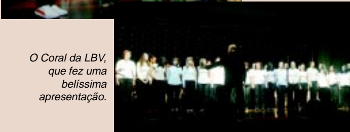
O Coral da LBV, que fez uma belíssima apresentação.