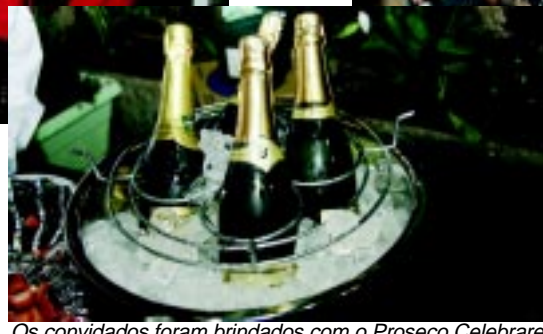
Os convidados foram brindados com o Prosecco Celebrare