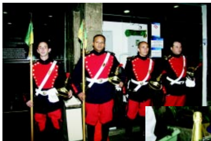
O tom solene do Super Cap foi garantido pelos Lanceiros da Polícia Militar