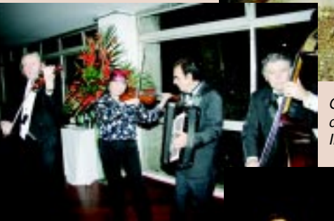
O toque de classe dos Violinos Internacionais.