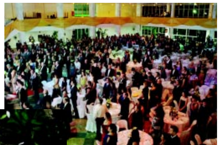
Centenas de pessoas, entre convidados, agraciados, autoridades e imprensa lotaram as dependências do Círculo Militar